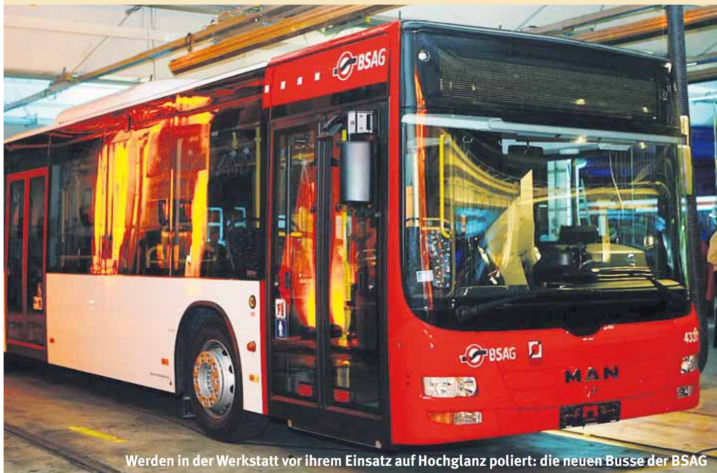
Werden in der Werkstatt vor ihrem Einsatz auf Hochglanz poliert: die neuen Busse der BSAG

Wir hoffen, dass durch die modernen und attraktiven neuen Fahrzeuge noch mehr Bürgerinnen und Bürger die ÖPNV-Angebote nutzen werden. In wirtschaftlich schwierigen Zeiten ist es keine Selbstverständlichkeit, dass Angebote nicht nur gehalten, sondern sogar noch verbessert werden können.“