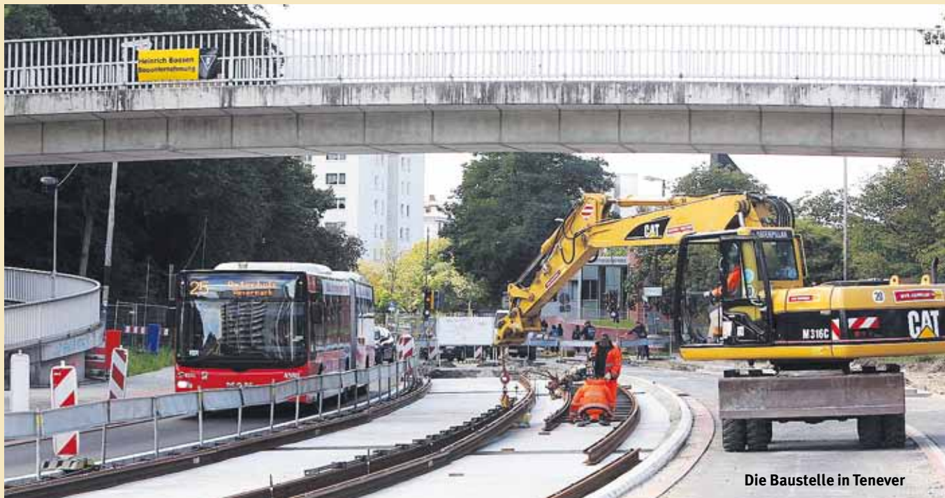
Die Baustelle in Tenever

20 Fahrgastbegleitende des Programms „Chance 50+“ sind bei der BSAG im Einsatz.